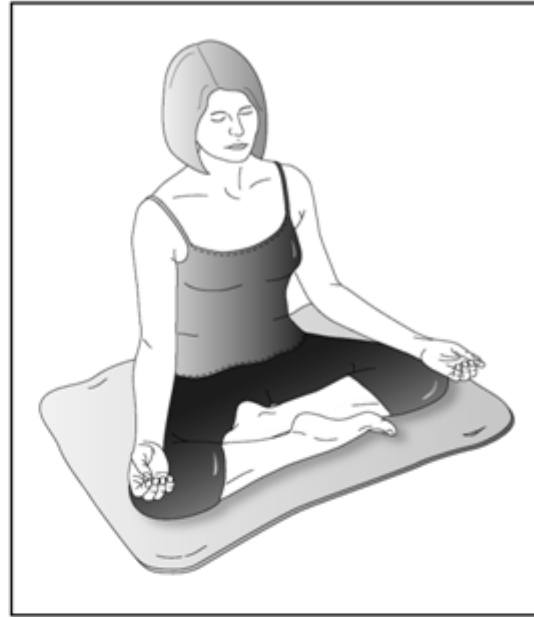
Posición con las piernas cruzadas. Mantenga la espalda derecha. Usar un cojín, manta, esterilla, y/o echarpe para estar cómodo/a puede ayudarle.