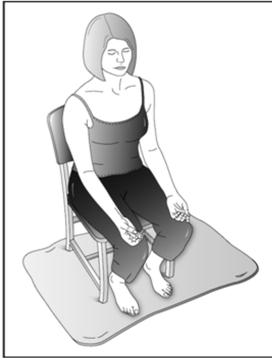
Posición sentada en una silla. Mantenga la espalda derecha.