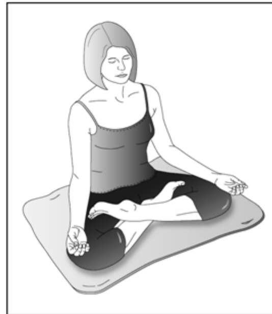
Posición de loto completa. Mantenga la espalda derecha. Usar un cojín, manta, esterilla, y/o echarpe para estar cómodo/a puede ayudarle.